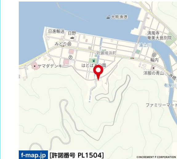
大字大熊（鳩浜町の山側です）